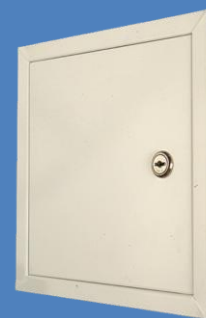
Серия RLMA с ключ

Размери на метални ревизионни отвори серия RLMA с ключ